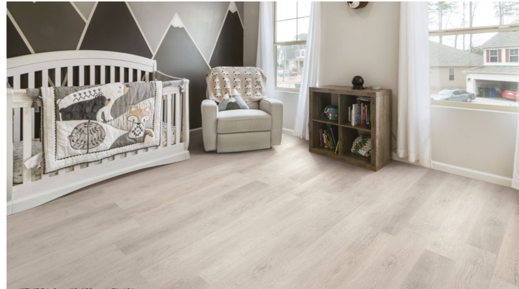
KENDRA Soya 18x152 cm · 7"x60"