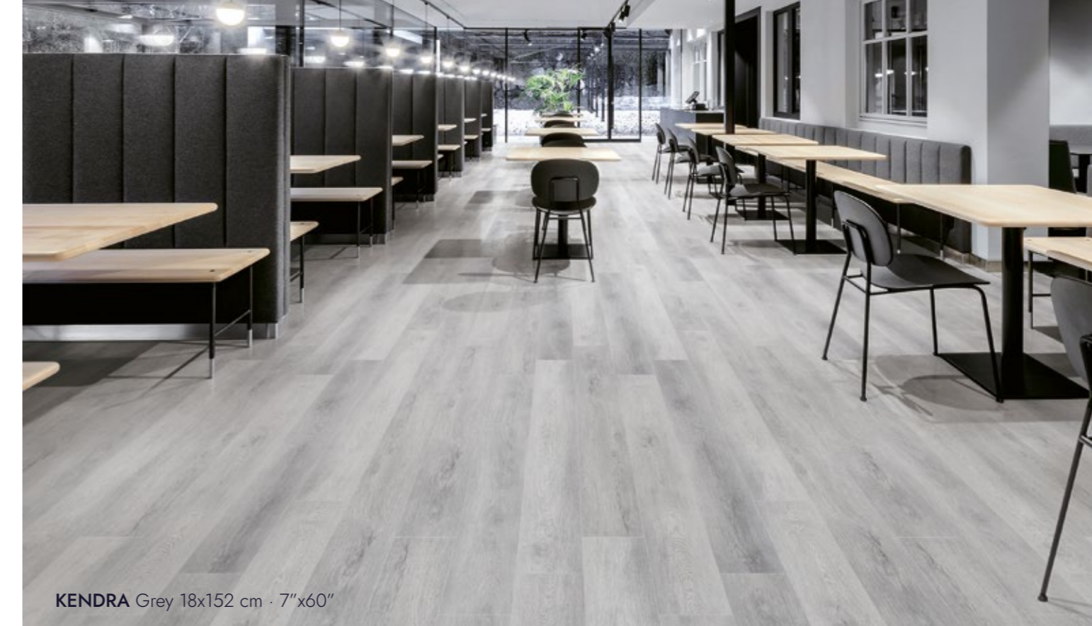
KENDRA Grey 18x152 cm · 7"x60"