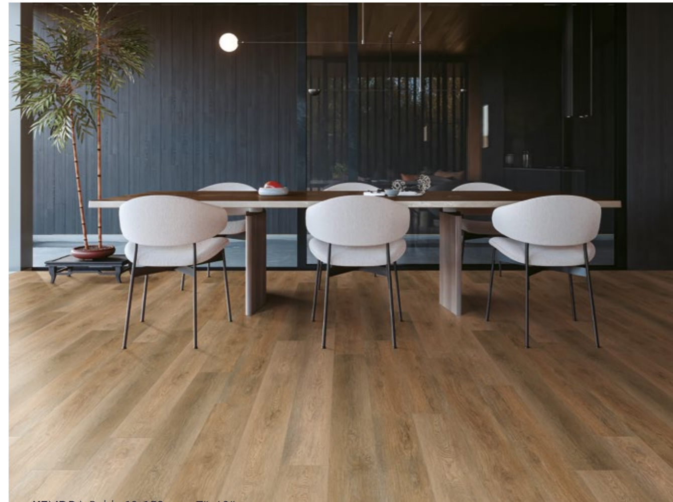
KENDRA Roble 18x152 cm · 7"x60"