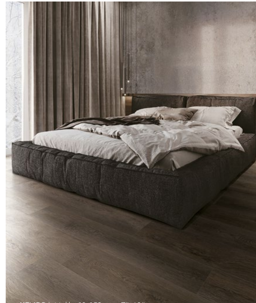
KENDRA Mokka 18x152 cm · 7"x60"