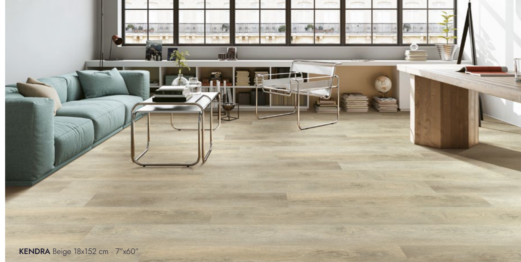
KENDRA Beige 18x152 cm · 7"x60"